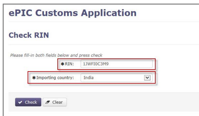
Slika 2: Unos podataka

Kada su popunjena oba polja, za učitavanje podataka korisnik treba kliknuti na polje "Odaberi" za učitavanje podataka. Rezultat pretraživanja bit će jedan od sljedećih: