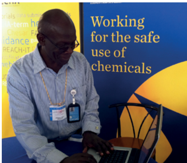
Un participante en la reunión ICCM-3 estudia el sitio web de la ECHA en una caseta de información de la Agencia en Nairobi.

va dirigida a los países candidatos y a los posibles candidatos a la adhesión, la PVE va dirigida a implicar a los 16 países que tienen frontera con la Unión. La ECHA ha contribuido a las políticas de ambos ámbitos en el campo de la aproximación, la aplicación y el cumplimiento de la legislación de la UE.