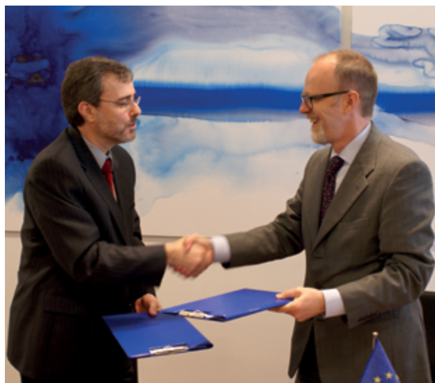
El Memorando de Entendimiento entre la ECHA y Canadá se firmó en 2010.

La UE y los países del Espacio Económico Europeo (EEE) que han aplicado el REACH y el CLP y los beneficiarios del Instrumento de Ayuda Preadhesión (IAP) y la Política Europea de Vecindad (PEV).