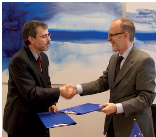
Le mémorandum d'entente entre l'ECHA et le Canada a été signé en 2010.

Pays de l'UE et de l'Espace économique européen (EEE) ayant mis en œuvre REACH et CLP et bénéficiaires de l'Instrument d'aide de préadhésion (IAP) et de la Politique européenne de voisinage (PEV).